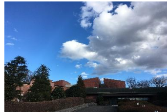
COEDO ブルワリー醸造所