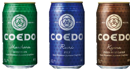
毬花-Marihana-, 瑠璃-Ruri-, 伽羅-Kyara-