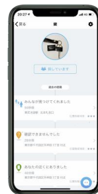
△位置情報通知イメージ