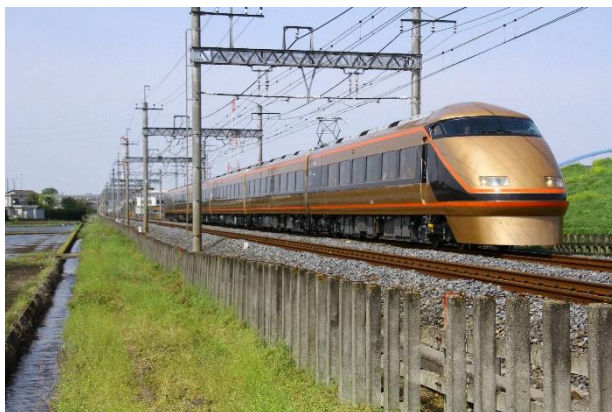
「スペースきぬがわ」で使用する東武鉄道100系スペース