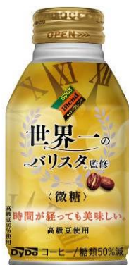
△「ダイドーブренд 世界一のバリスタ監修<微糖>」（イメージ）

※世界一のバリスタ：ワールドバリスタチャンピオンシップ 第14代チャンピオン ピート・リカータ氏