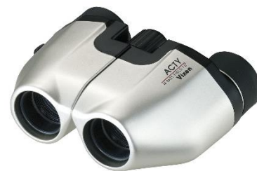
△ (株)ビクセン双眼鏡