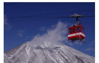
△ 明智平ロープウェイ(イメージ)