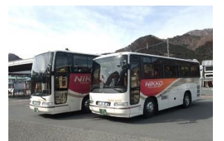
△ 日光交通 巡回バス(イメージ)