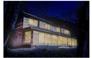
△ イタリア大使館ライトアップ(イメージ)