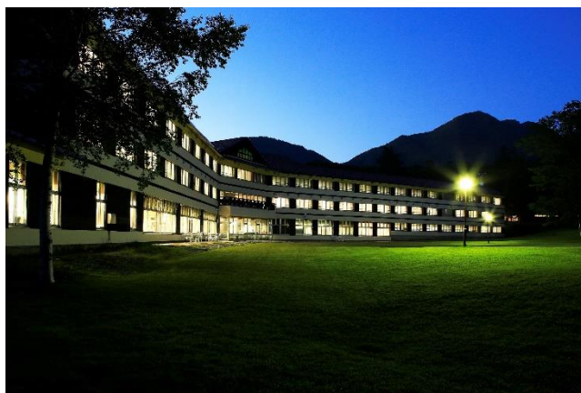
△ 日光アストリアホテル