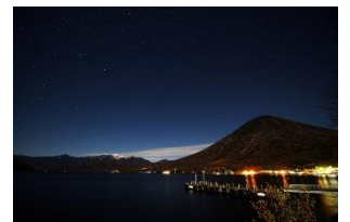
△ 夜間の中禅寺湖(イメージ)