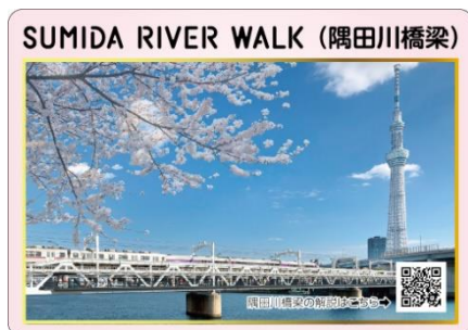
△浅草駅発売分 表面イメージ