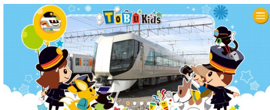
△TOBU Kids トップページ