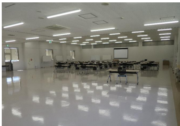
イベントで使用する総合教育訓練センター教室