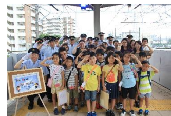
△これまで開催したイベント (例)