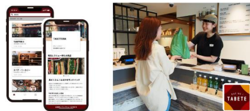
△ 「TABETE」サービス (イメージ)

※本実証実験では、池袋駅構内のイベントスペースでの販売を基本とし、販売状況に応じてアプリ上でも販売情報を掲載します。