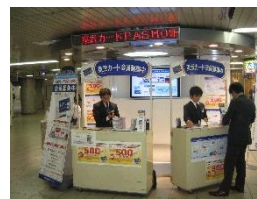
△池袋駅 イベントスペース (イメージ)