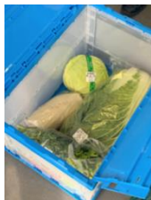
△売れ残った農産物 (イメージ)