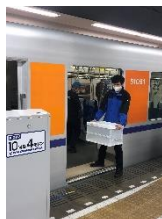
△荷降ろし (イメージ)