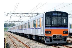
△ 50090 型車両