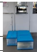
△ 積み込みイメージ