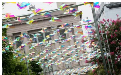
△光彩楓螢