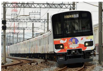
△ 池袋・川越アートトレイン