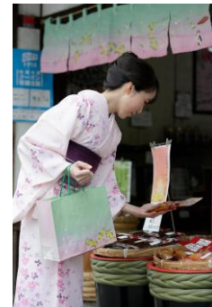
△ ショッピングバッグを持って 着物散策（イメージ）