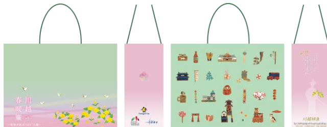
△ ショッピングバッグ（イメージ）