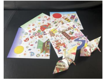
△ 池袋・川越アートトレイン柄おりがみ

4 その他 4月10日(土)～5月9日(日)の川越春暖簾開催中に小江戸川越クーポンを利用し、川越駅観光案内所にお立ち寄りいただいたお客さまを対象に、“川越に彩りを加える”というテーマで実施している「池袋・川越アートトレイン」の柄をデザインしたおりがみをプレゼントします。 ※お一人さま1点限り、先着順