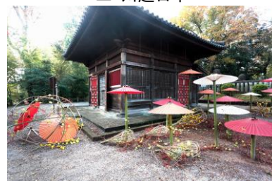
△ 和傘紅葉 in 川越喜多院