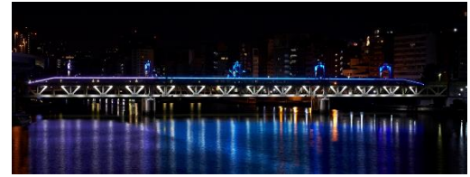
△ 隅田川橋梁特別色「90th感謝」ライトアップ （イメージ）

通常、隅田川橋梁は日没後、東京スカイツリー®のライトアップ「雅」「粋」「幟」と同系色で毎日ライトアップしています。