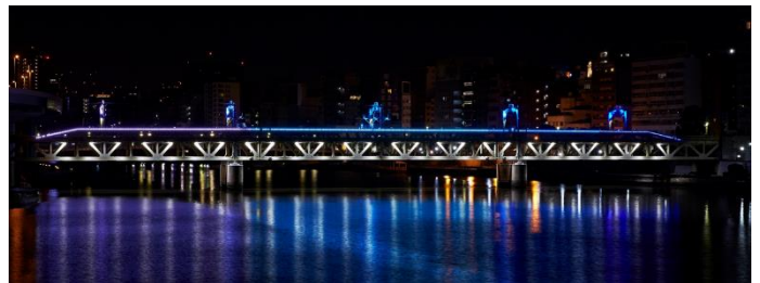
△ 隅田川橋梁特別色「90th感謝」ライトアップ（イメージ）