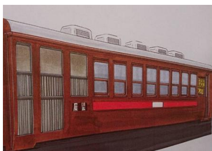
△展望車（オハテ12-1 ぶどう色）