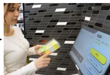
③ 出口のディスプレイで購入商品を確認して決済