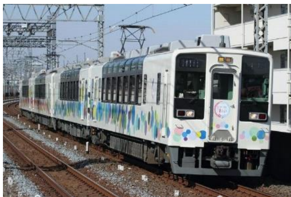
△臨時列車で使用する634型（予定）