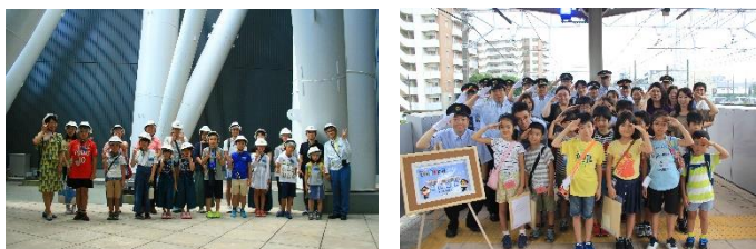
△これまで開催したイベント（例）