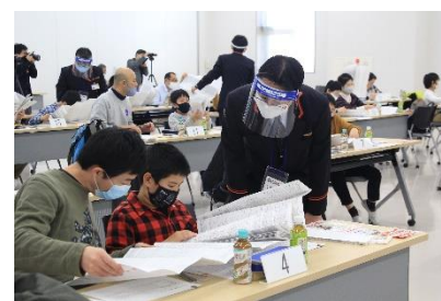
△昨年実施したイベントの様子