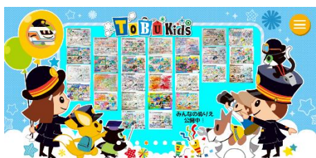
△TOBU Kids トップページ