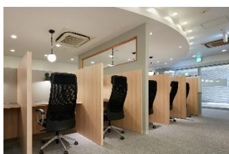
Solaie +Work ふじみ野