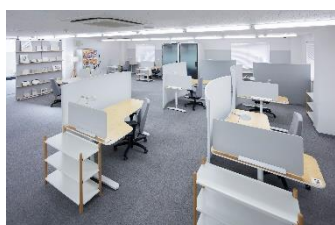
Solaie +Work 草加松原