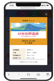
▲デジタルフリーパス（イメージ）

ご旅行の目的（歴史・文化・伝統・自然等）や場所に合わせ、より使い易く、よりお得にご利用いただくことができる4種類のデジタルフリーパスを購入できます。従来の企画乗車券と比べ、より細かいニーズに合わせたフリーパスを購入できるほか、特典協賛店舗が約50店舗に増え、日光・鬼怒川エリアをこれまで以上にお楽しみいただけるようになります。