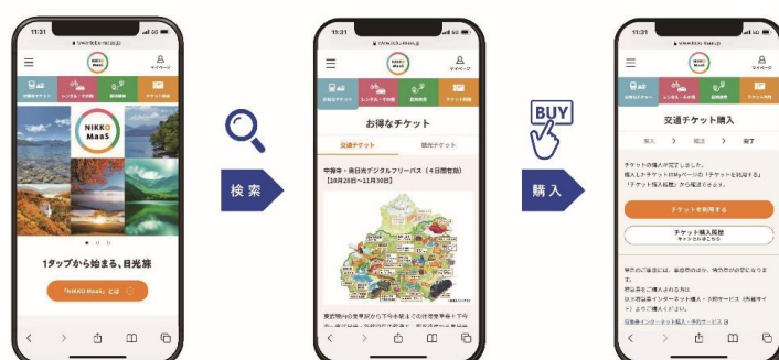
▲日光地域の交通と観光コンテンツをワンストップで検索・購入（イメージ）

「NIKKO MaaS」は、東武線各駅から日光までのフリーパスをはじめ、日光地域でのカーシェア・観光コンテンツ等をすべてスマートフォン1台でスムーズに検索・購入・利用できる新しい旅の形をサポートするシステムです。従来のようにチケット手配・レンタカー予約・観光コンテンツ検索をそれぞれのサイトで個別に行うことなく、「 NIKKO MaaS WEB サイト 」経由で検索・購入・利用することができます。