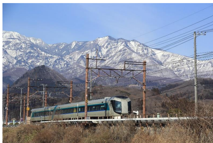
△ 日光・鬼怒川エリアを走行する特急リバティ