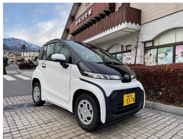
△ 「NIKKO MaaS」EV カーシェアリング