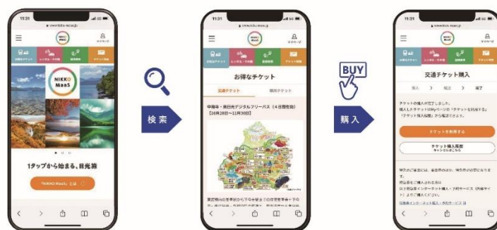
▲日光地域の交通と観光コンテンツをワンストップで検索・購入 (イメージ)

「NIKKO MaaS」は、東武線各駅から日光までのフリーパスをはじめ、日光地域でのカーシェア・観光コンテンツ等をすべてスマートフォン1台でスムーズに検索・購入・利用できる新しい旅の形をサポートするシステムです。従来のようにチケット手配・レンタカー予約・観光コンテンツ検索をそれぞれのサイトで個別に行うことなく、「 NIKKO MaaS WEB サイト 」経由で検索・購入・利用することができます。