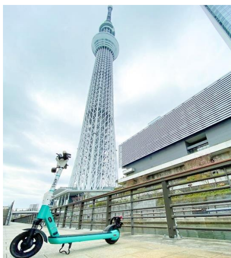
△LUUP 電動キックボード