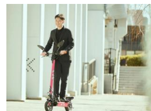
△mile 電動キックボード