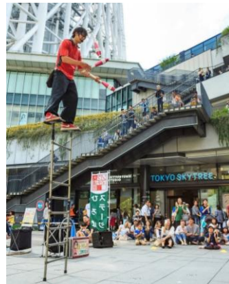
△ソラマチ大道芸フェスティバル (過去の様子)

※開催時間など、詳細は決定次第、東京ソラマチ公式HPにてお知らせします。 ( https://www.tokyo-solamachi.jp/ )