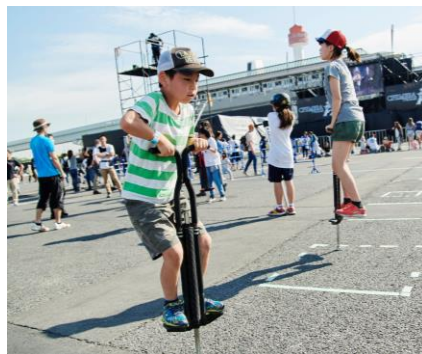
△イベントイメージ