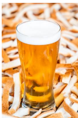
△蔵前 WHITE イメージ

本イベントの売り上げの一部は、東武鉄道が河川敷地における施設の維持管理及び良好な水辺空間の保全、創出を図るための費用に充てます。