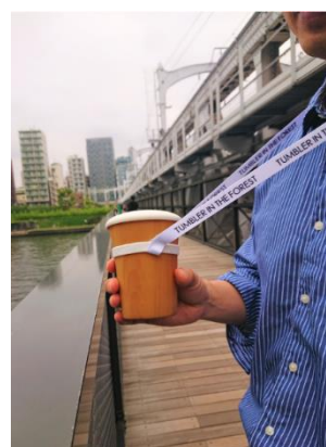
△森のタンブラー イメージ