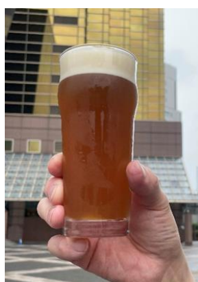
△すみだ BROWN イメージ