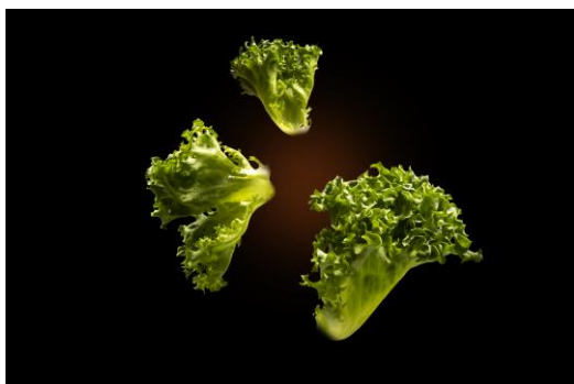
△クリスピーレタス

コーラルリーフフェザー、クリスピーレタス、ペッパークレソン、レッドカラシナなど希少性の高い葉物野菜を中心に計6～10種類を同時に栽培します。 ※実証実験のため、変更になる場合があります。