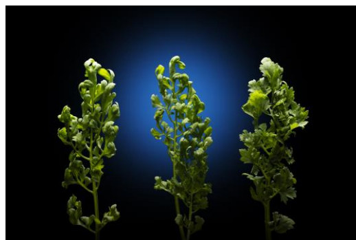
△ペッパークレソン