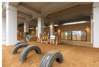
△草加松原どろんこ保育園

働く子育て世代を支援するため、駅チカ保育所「草加松原どろんこ保育園」を整備しています。