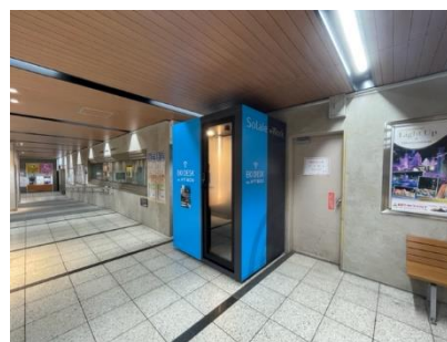
△エキデスク獨協大学前〈草加松原〉