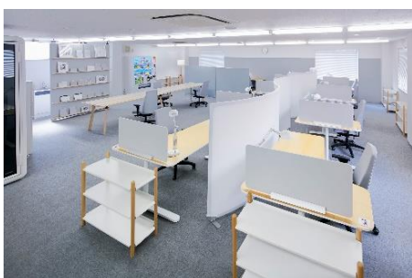
△ソライエプラスワーク草加松原