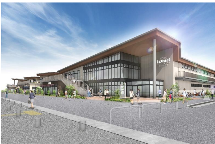
△建物イメージパース