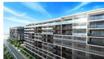
△ソライエテラス（イメージ）