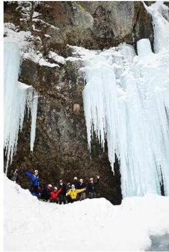
△庵滝・氷瀑トレッキングツアー