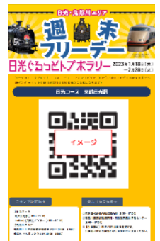
△スタンプポイントに掲示してあるポスター(イメージ)