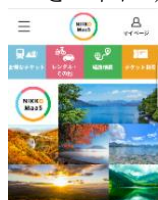
△NIKKO MaaS 画面