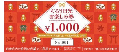
△クーポン券(イメージ)