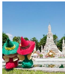
△東武ワールドスクウェア