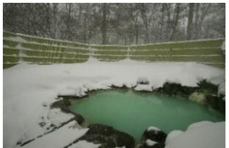
△露天風呂「森乃精」 (日光アストリアホテル)