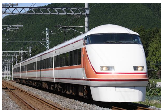
△特急スペーシア八王子きぬ（イメージ）