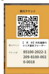
△フリーパスチケット