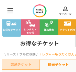
△チケット申込画面