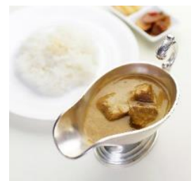
△百年ライスカレー(イメージ)

<その他> 東武日光駅ツーリストセンターで購入当日に「日光・鬼怒川エリア週末フリーパス」チケット画面を提示いただき、クーポンをお求めのうえ金谷ホテルへお越しください。