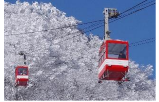
△明智平ロープウェイ