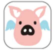
△TOBU POINT オリジナル キャラクター「トブタン」