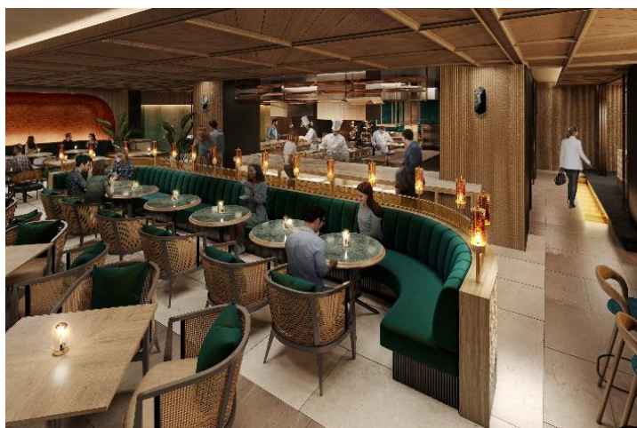
△オールデイダイニング RISTASIX (イメージ)