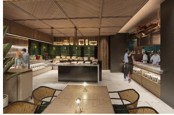
△オールデイダイニング R I S T A S I X (イメージ)