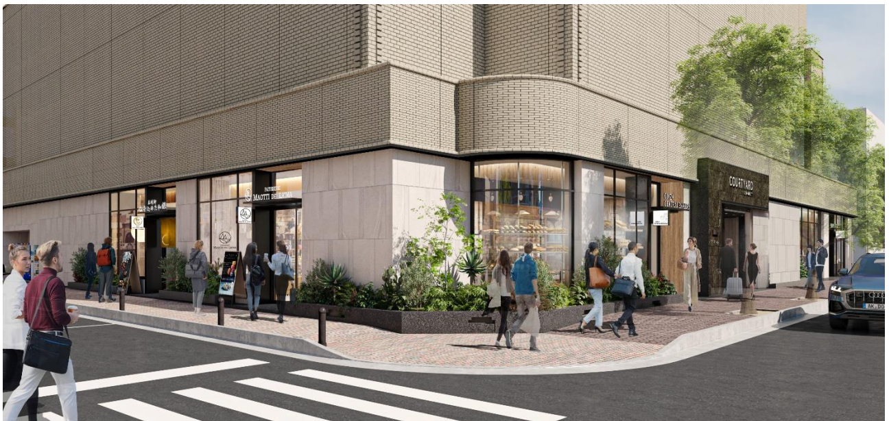
△ 1階専門店エリア (イメージ)