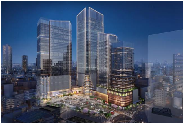
■イメージパース①（北西側より計画建物を望む）