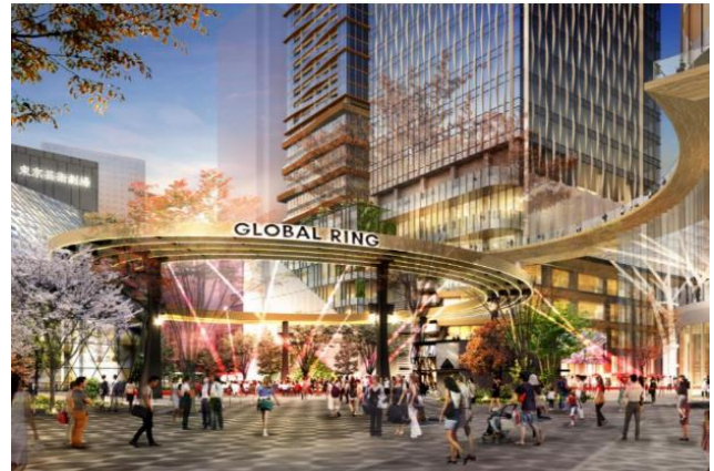
■イメージパース②（南東側より池袋西口公園、計画建物を望む）