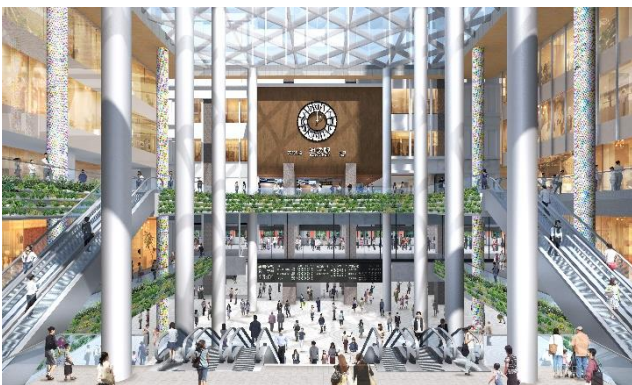
■イメージパース③（地上から中央地下通路を望む）