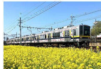
▲運行中のベリーハッピートレイン