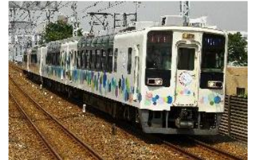
▲634型 (スカイツリートレイン)