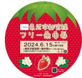
▲フリー乗車券 (イメージ)