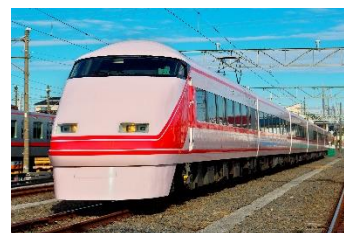
▲運行中のいちごスペーシア