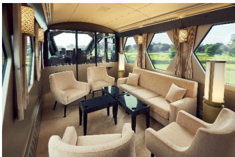
△ コックピットスイート

URL： https://www.tobu-card.co.jp/campaign/spaciax2024/