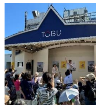
△ 1DAYイベント （イメージ）