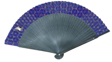
△ 1周年記念カフェメニュー・商品（イメージ）