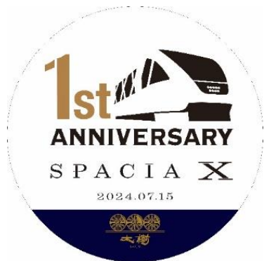
△ ヘッドマークデザイン（イメージ）