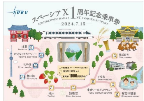
△ 1周年記念乗車券（イメージ）