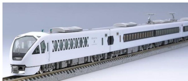
△ TOMIX 製（Nゲージ）東武N100系スペース X

各施策の詳細については、決定次第東武鉄道ホームページ・SNS・スペース X 1周年特設サイト (URL : https://www.tobu.co.jp/spaciax/1st-anniversary/ ) 等にて順次お知らせします。