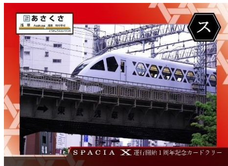
△ オリジナルカード（イメージ） ※駅によりデザインは異なります