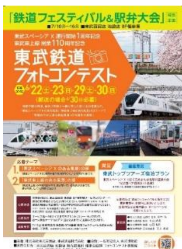
△ フォトコンテスト案内ポスター

備 考： 7月13日（土）の1DAYイベントでは、子供制服着用体験や駅長じゃんけん大会等のイベントを実施予定です。