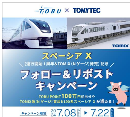
△ キャンペーンバナー

内 容：東武鉄道公式Xアカウントをフォローし、キャンペーン投稿をリポストして いただけた方の中から抽選で、100万円相当のTOBU POINT、7月下旬発売 予定のTOMIX製Nゲージ 東武N100系スペース Xセットやオリジナルグッズを プレゼントします。