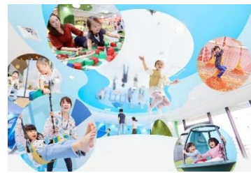
△ ちきゅうのにな（イメージ）