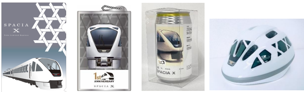
△ 発売グッズ（イメージ。実際の商品とはデザインが異なる場合があります）

※詳細は、東武商事公式HP（ https://www.tobushoji.co.jp/ ）をご覧ください。