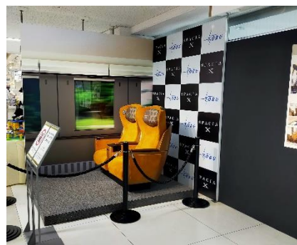
△ プレミアムシート 展示イメージ ※8階催事場鉄道フェスティバル で展示します