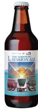
△TOBU×KINTETSU 1st SESSION ALE （瓶イメージ）