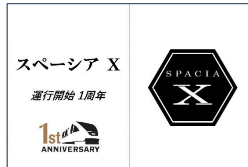
△ カード台紙（イメージ）