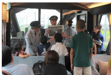
△ 車内イベント（イメージ）

行います。詳細は、こちらをご覧ください。 https://tobu-kids.com/event/154/