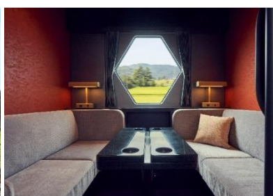
△コンパートメント