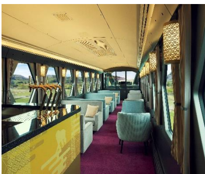
△コックピットラウンジ