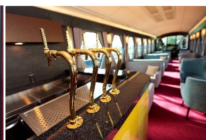
△カフェカウンター