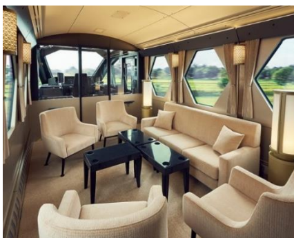
△コックピットスイート

日々、研鑽を重ねブラッシュアップを続ける当列車が、今後、首都圏エリアの鉄道観光のシンボルとなり、ますます発展していく可能性に期待して、ここに「多様性に応える、時代に即したエンターテイナーな特急列車」特別賞を授与します。