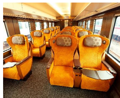
△プレミアムシート