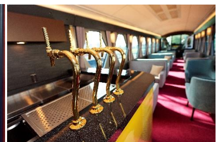
△カフェカウンター