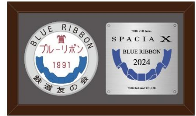
△ブルーリボン賞受賞記念 プレートレプリカセット

1991年にブルーリボン賞を受賞した100系スペーシアの車内に掲出している記念プレート（レプリカ）と、今回受賞したN100系スペーシア Xの車内に掲出する記念プレート（レプリカ）のセット商品です。スペーシアの歴史と伝統を間近に感じられる商品です。発売時期、価格、販売箇所等は別途お知らせします。