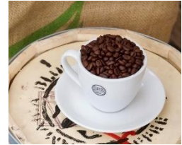
△BLUE MOUNTAIN RIBBON (イメージ)

コーヒーの最高峰「ブルーマウンテンNo.1 クライスデール」を中心にブレンドした、まさにブルーリボン受賞にふさわしい高級感漂う逸品です。優雅で芳醇な香り、優しい甘みと柔らかな酸味が特徴です。