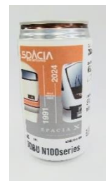
△N100系 ブルーリボン賞受賞 記念ステッカー付ドリンク