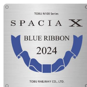
△記念プレートデザイン