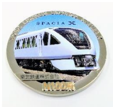
△スぺーシア X ブルーリボン賞受賞 記念メダル