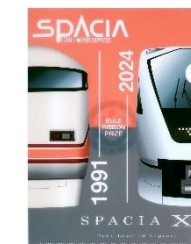
△スぺーシア X ブルーリボン賞受賞 記念クリアファイル