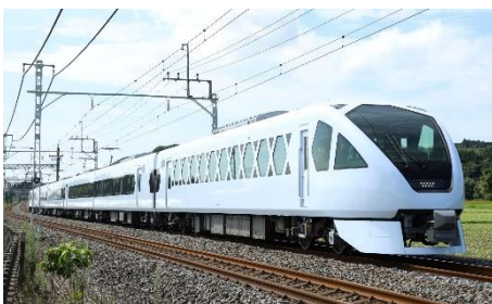
△スペーシア X 外観

新型特急スペーシア X (SPACIA X) 特設サイト： https://www.tobu.co.jp/spaciaX/