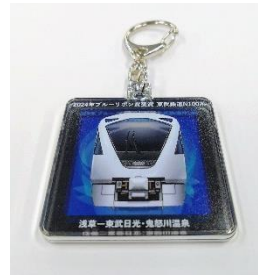
△N100系 ブルーリボン賞受賞 記念キーホルダー