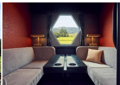
△コンパートメント