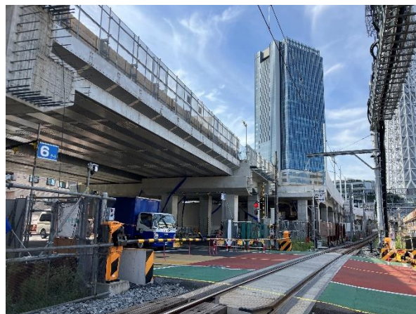
△とうきょうスカイツリー駅付近高架橋（左：下り線高架橋全景 右：伊勢崎線第2号踏切道部分）