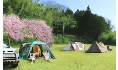
△キャンプ場の様子(イメージ)