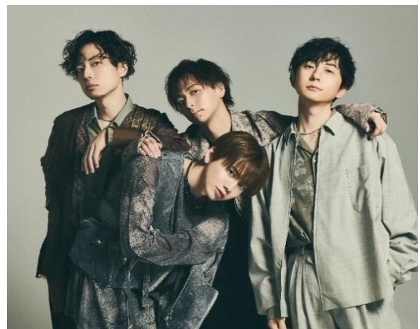
△ Natural Lag

バンド名の由来は Natural (自然な)と Lag (ズレ、遅れ)の造語であり、自分以外の人とは必生するズレがあることによって他人を嫌いになったり愛しく思えたりする、そんな人との自然な Lag を大切に思える曲を作っていきたいという意味が込められている。