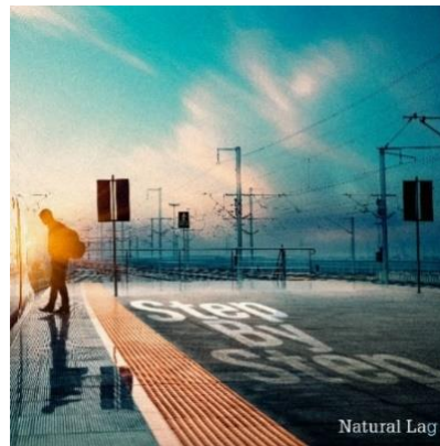
△ 『Step By Step』ジャケット写真

備 考：当日は、Natural Lag メンバー参加による新発車メロディお披露目式の開催を予定しますが、本式典は主にマスコミ向けであり、 一般のお客様向け観覧エリアのご用意はございません のでご了承ください。