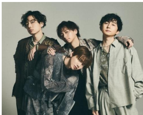
△ Natural Lag