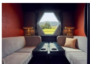
△コンパートメント