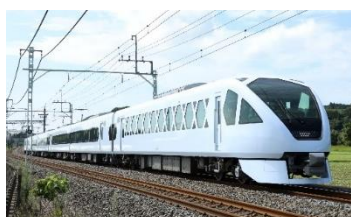
△スペーシア X 外観

新型特急スペーシア X (SPACIA X) 特設サイト： https://www.tobu.co.jp/spaciaX/