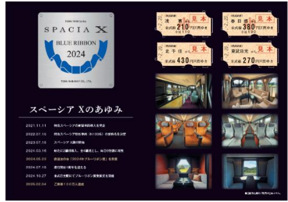
△ 記念乗車券台紙（イメージ）