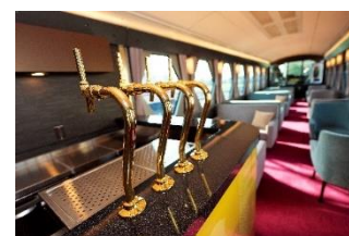
△カフェカウンター