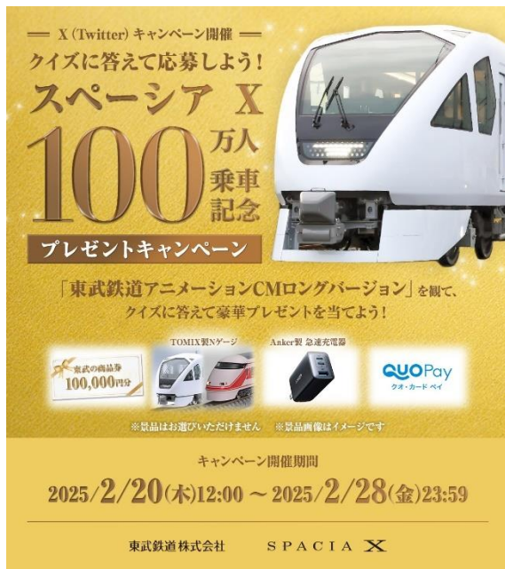
△ キャンペーンバナー

期 間：2025年2月20日（木）12時00分～2月28日（金）23時59分まで