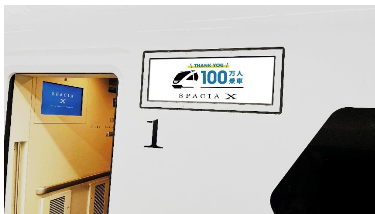
△ 表示イメージ（側面表示器）