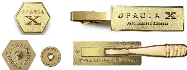
△ ピンズ、タイピンの表面・裏面デザイン