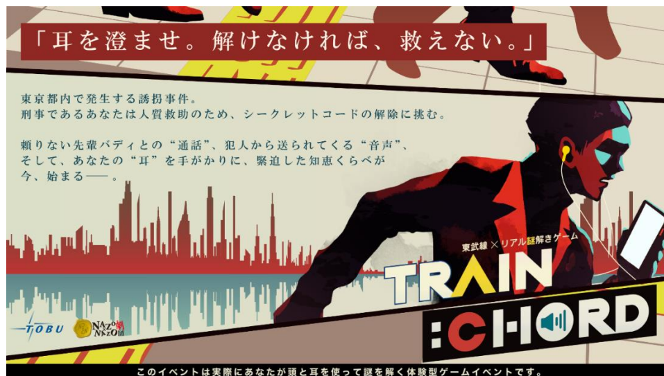
△ メインビジュアル