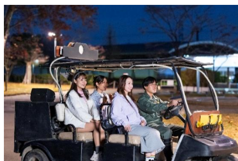
△ アドベンチャー・ナイト（イメージ）

東武鉄道株式会社（本社：東京都墨田区、以下：東武鉄道）、東武トップツアーズ株式会社（本社：東京都墨田区、以下：東武トップツアーズ）、株式会社にしがき（本社：京都府京丹後市、以下：にしがき）は、2026年3月、埼玉県白岡市の東武動物公園隣接地において、「ドームテント×動物園」＆「ヴィラ×プライベートドッグラン」、2つのコンセプトをもつ埼玉県最大級のグランピングリゾート「グランフィルリゾート東武 - GRANPHIL RESORTS TOBU -」をオープンします。