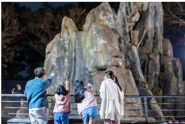
△ アドベンチャーナイト(仮称) (イメージ)

宿泊当日の同園開園時間からチェックアウト日の閉園時間まで、時間を気にすることなく園内をお楽しみいただけます。