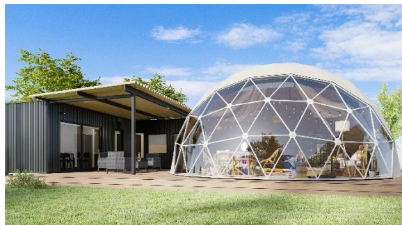
△ アドベンチャー・ドーム (イメージ)