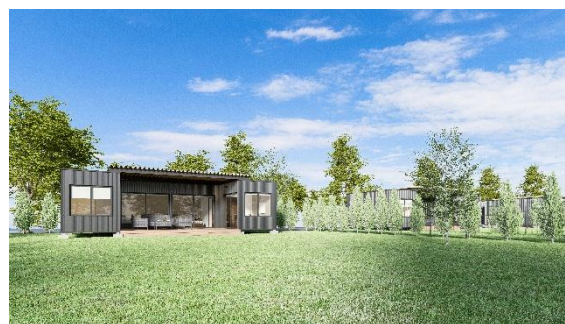
△ シンフォニー・ヴィラ (イメージ)