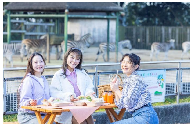
△ サバンナテラス・モーニング(仮称) (イメージ)