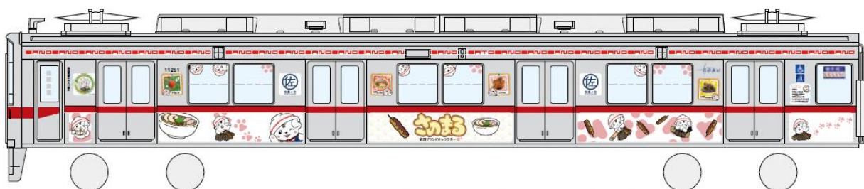
△「さのまるっと♥とれいん」デザイン(イメージ)