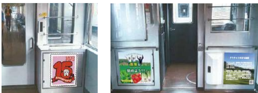
△車内の装飾(イメージ)