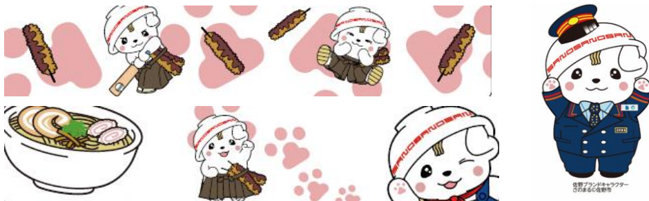
△外観に使用されるイラスト(イメージ)