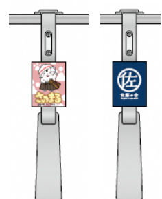
△つり革デザイン(イメージ)