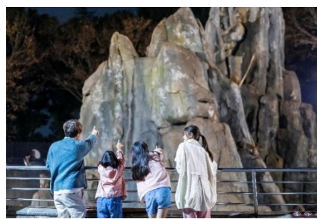
△ アドベンチャー・ナイト(イメージ)