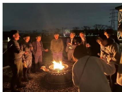
△ 焚火(ファイヤースペース)