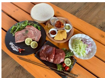
△ BBQメニュー(イメージ)

地元埼玉県武州和牛を取り入れたものや、様々なお肉の種類をお楽しみいただける「サバンナBBQ」をご用意しています。