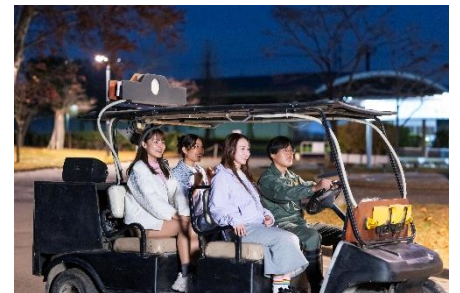
△ 「アドベンチャー・ナイト」(イメージ)