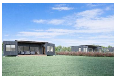
△ シンフォニー・ヴィラ (イメージ)