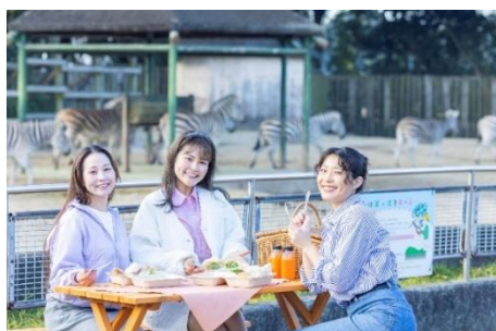
△ サバンナテラス・モーニング(イメージ)

同園開園までの朝食時間に、園内サバンナエリアで動物を間近で見学しながら朝食をご提供いたします。運が良ければ動物も朝食を食べているかも？