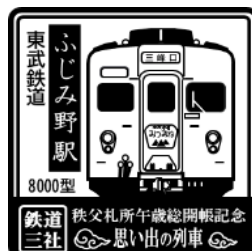
東武鉄道 ふじみ野駅