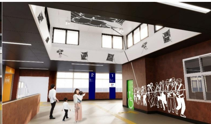
△改札内高天部パース