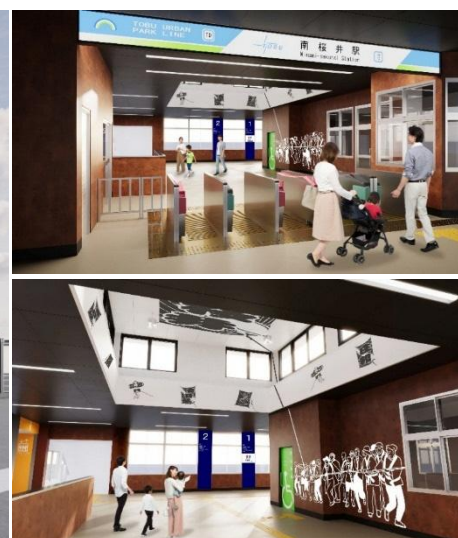
△改札口パース（上） /改札内高天部パース（下）