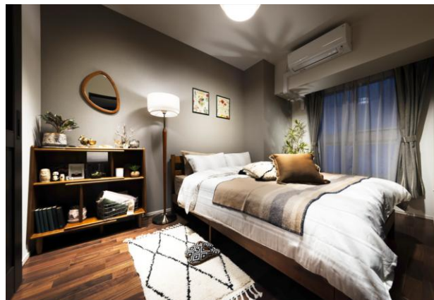
▲マスターベッドルーム