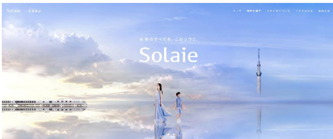
▲公式ホームページイメージ

202603301145226Tq423Yh-0eT9bUzFY96DQ.pdf