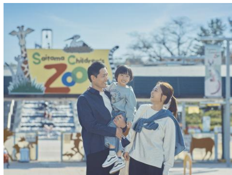
▲GLOBAL WORK（埼玉県子ども動物自然公園）