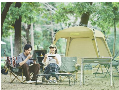
▲niko and ...（くらかけ清流の郷）