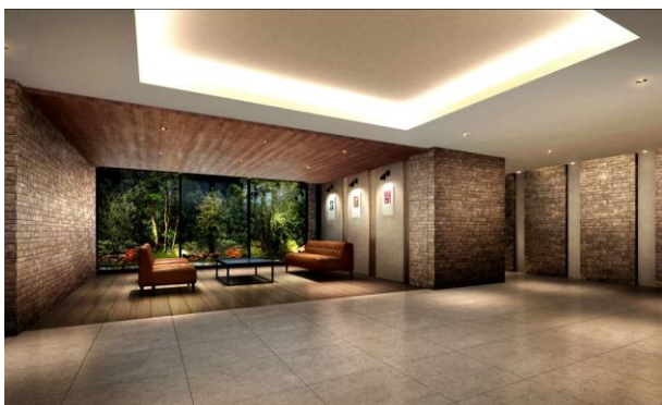
▲ウェルカムラウンジ完成予想CG