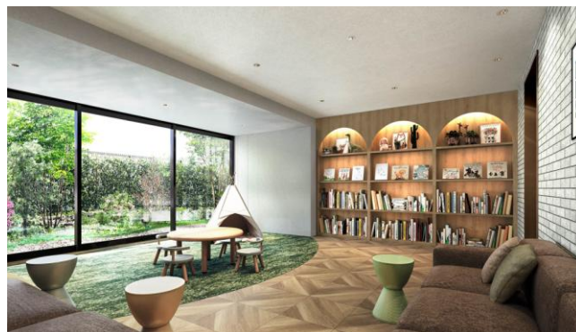
▲ミーツラウンジ完成予想CG