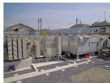
△かさ上げ後の変電所

浸水が想定される場所や実際に浸水した場所の鉄道用変電所について、更新改良工事等の計画にあわせて施設のかさ上げを実施しています。