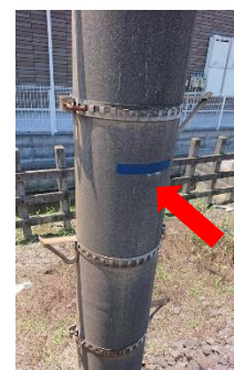
△浸水深マーキング

これにより、従業員が現地にて周辺の浸水レベルを容易に確認できる環境が整備されるほか、今後施設の更新を行う際のかさ上げの目安に活用していきます。