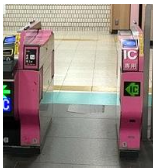
既存改札機(池袋駅)

顔認証などの機能を既存の改札機にアドオンできる仕組みにより、改札機本体の新規入れ替えを伴わず、鉄道事業者の導入にかかる初期コストや工期を抑制でき、スピーディーな実装が可能です。