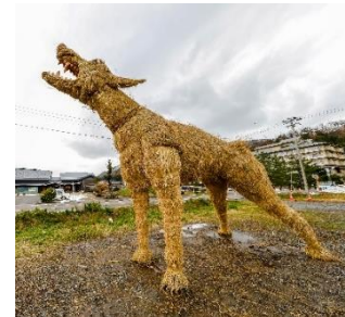
△犬のわらアート（参考）