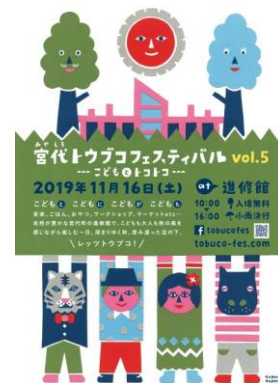
△宮代トウブコフェスティバルポスター