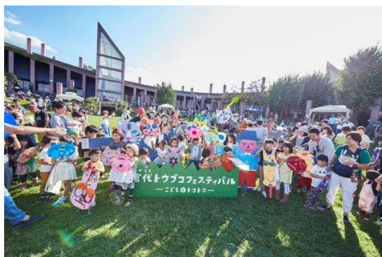
△宮代トウブコフェスティバル （過去の様子）

東武鉄道と宮代町では、今後も各種連携を図り、宮代町の地域活性化に努めてまいります。概要は別紙のとおりです。