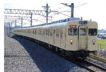
△臨時電車で使用する8111編成（イメージ）