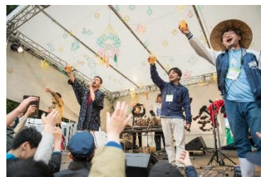
△大宴会 in 南会津の様子（イメージ）