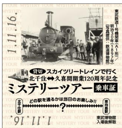
△記念乗車証(イメージ)