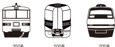
△車両がデザインされたスタンプ(イメージ)