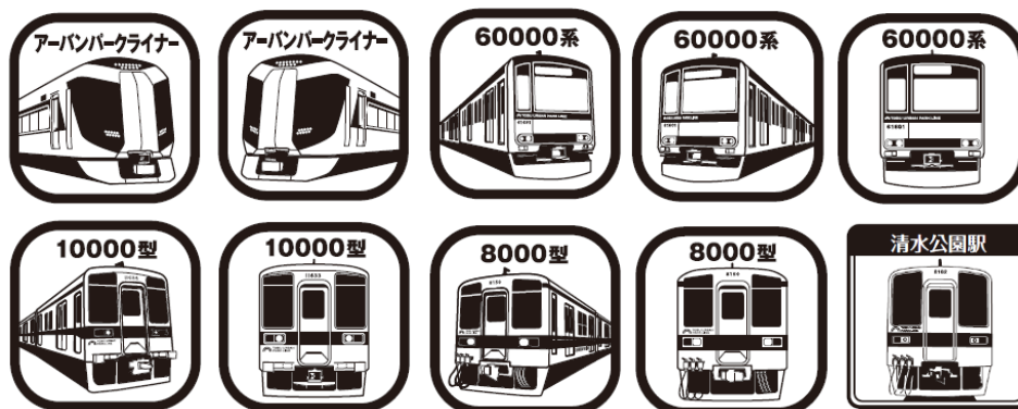
△スタンプ(イメージ)