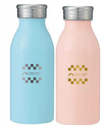
Wチャンス賞 オリジナルボトル (イメージ)