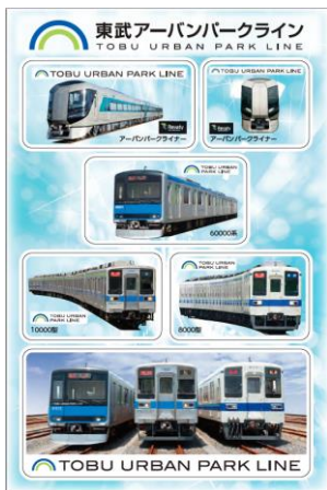
清水公園駅賞 オリジナルシール (イメージ)