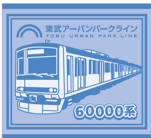
10駅達成パーフェクト賞 オリジナルハンドタオル (イメージ)