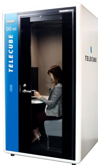
△テレキューブ外観（イメージ）