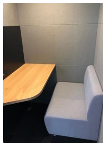
△テレキューブ内観（イメージ）