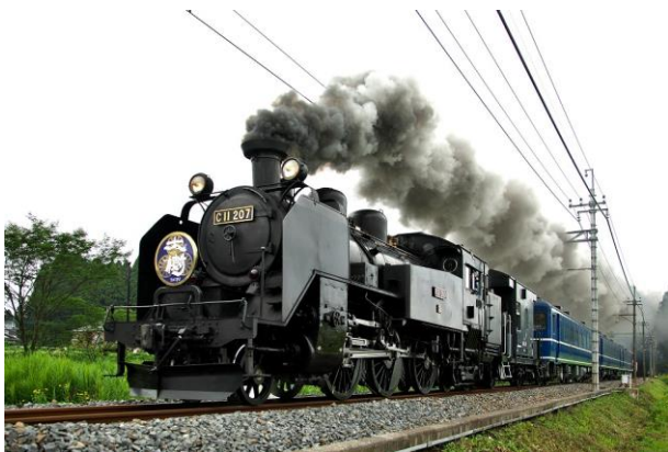
△運行開始から1周年を迎えるSL大樹