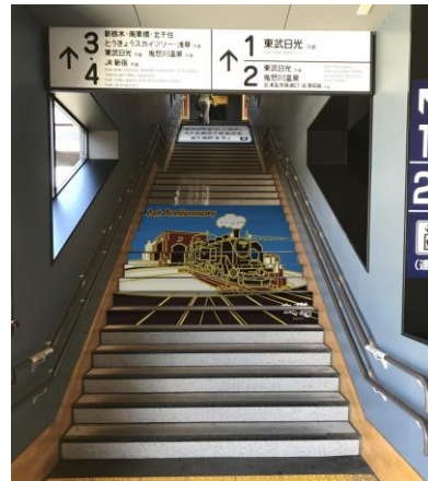
△下今市駅記念装飾(イメージ)