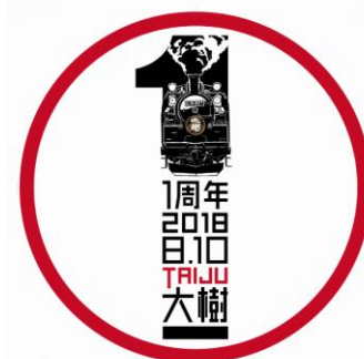
△オリジナルヘッドマーク