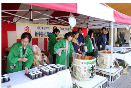
△振る舞い酒の様子(イメージ)

8月10日(金)から発売開始となる株式会社タカラトミーの鉄道玩具プラレール「S-51 SL大樹」をはじめとする各種SL・鉄道グッズの販売や、地元の方々によるお酒の振る舞い、キッチンカーでの飲食販売などを予定しています。