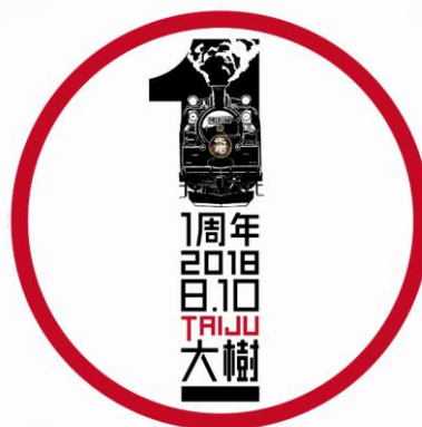
△1周年オリジナルヘッドマーク