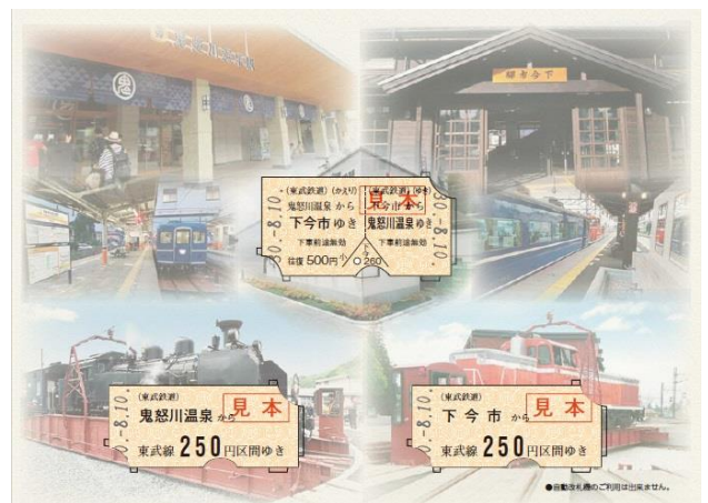
△記念乗車券(イメージ)