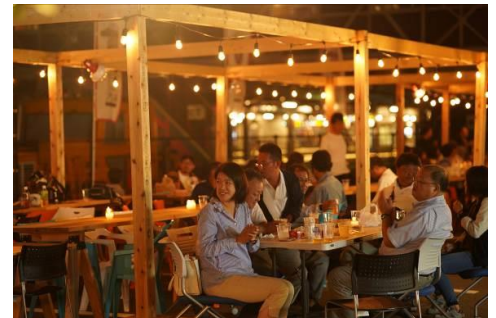
△昨年の日光ビアガーデン会場の様子