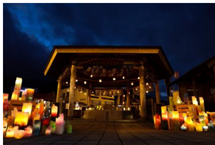
△足湯キャンドルナイト(イメージ)

鬼怒川温泉駅前であり、本イベント会場内にある「鬼怒太の湯」(足湯)を、地域のキャンドル業者「One Play-it (ワンプレイト)」とコラボレーションし装飾するほか、会场上空を複数の白い風船で彩り、日光・鬼怒川エリアを走行する「SL大樹」から出た煙や、「日光ビアガーデン」のビール泡をバルーンアートで表現するなど、幻想的な空間を演出します。