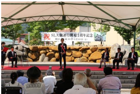
△昨年の運行開始1周年感謝祭の様子