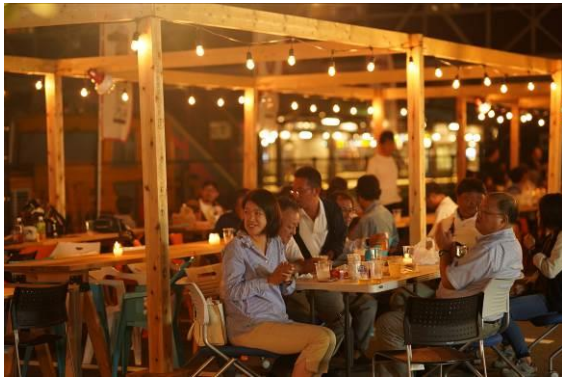
△昨年の会場の様子