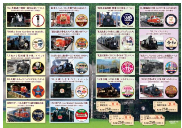
△記念乗車券(イメージ)