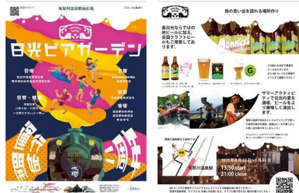
△イベントパンフレット（イメージ）