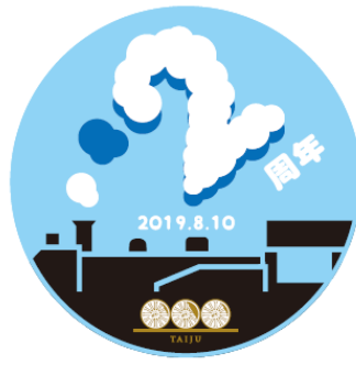
△2周年オリジナルヘッドマーク