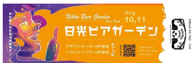
△ビール一杯無料券(イメージ)

※未成年のお客さまや、車の運転などによりお酒が飲めないお客さまは、同券を「ソフトドリンク一杯無料券」としてご利用いただけます。