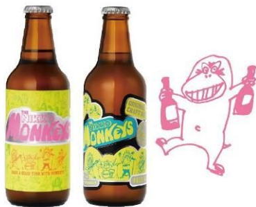
△ THE NIKKO MONKEYS（イメージ）