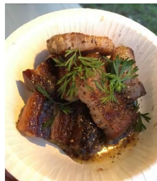
△ いぶすも〜く 燻製ベーコン（イメージ）