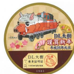
△記念乗車証 （イメージ）