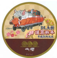
△正月限定ヘッドマーク （イメージ）

※「猪倉山 東光院 泉福寺」…日光市猪倉に所在。815（弘仁6）年弘法大師空海上人が薬師如来を刻し草庵を結び、東光院と名付けたのを開創としている。現在の本堂は1975（昭和50）年に建立されたもので、本尊胎蔵界大日如来、弘法大師、興教大師、理源大師、阿弥陀如来、地藏菩薩をお祀りしている。