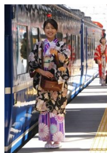
△昨年の着物着用によるおもてなしの様子