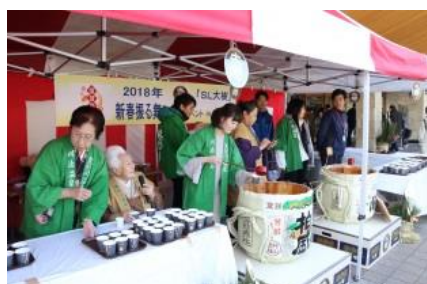
△昨年の振る舞い酒の様子